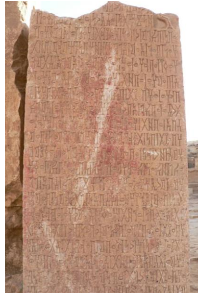
(الذيف ٨ / AL-Dhafeef 8) الشكل رقم (٤)