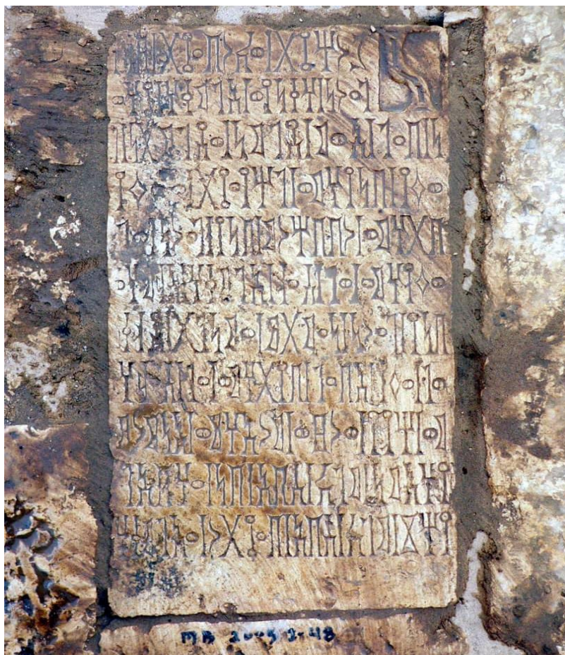
الشكل رقم (٥) (الذفيف ٩ / 9 AL-Dhafeef)