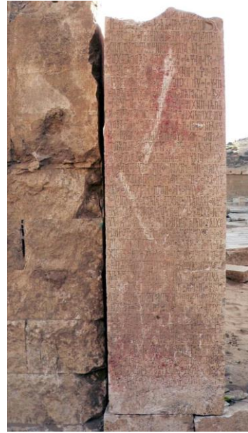
(الذيف ٧ / AL-Dhafeef 7)